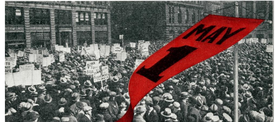
১৯৩০ সালে নিউইয়র্কের ইউনিয়ন স্কোয়ারে শ্রমিকদের সমাবেশ