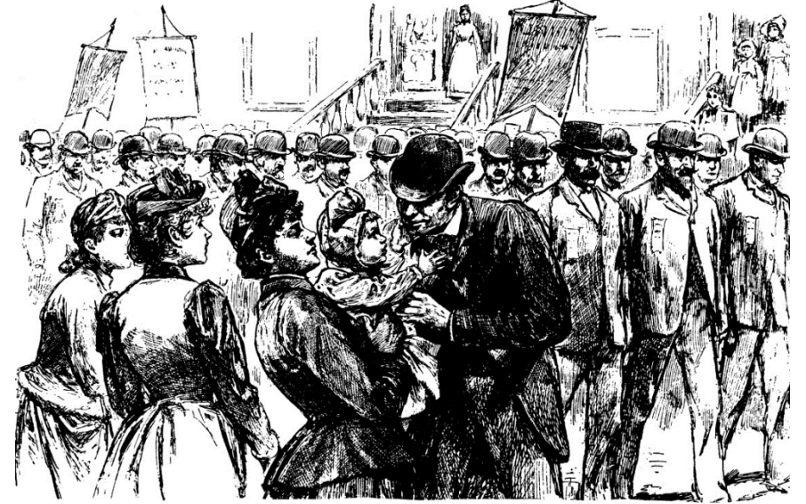
১৮৯০ সালে শিকাগোর শ্রমিকরা ১ম আন্তর্জাতিক মে দিবসে প্যারেড করছেন